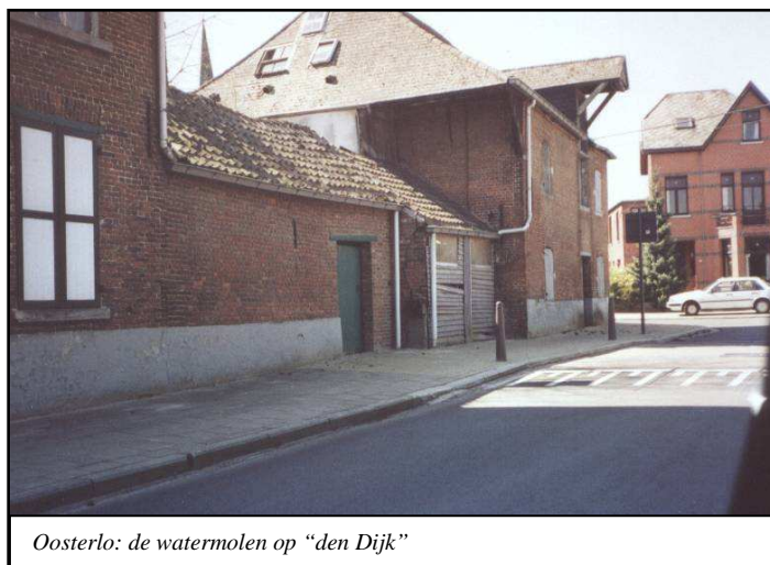
Oosterlo: de watermolen op "den Dijk"