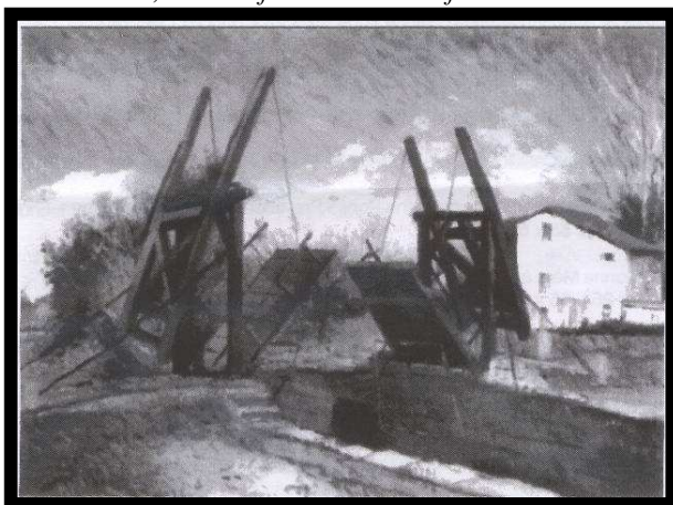
Pont de Langlois, Arles ( Van Gogh achterna.....)