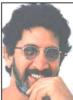
Momenteel rest van het baardgewas alleen nog maar een bescheiden snor...

After more than 40 one man exhibitions globally since 1972, they include: Chase Manhattan Bank New York, USA – Musée d’Affiche, Paris – Frans Masereel Centrum, Belgium – Private collections USA, Europe, Australia, South Africa and the Gulf States