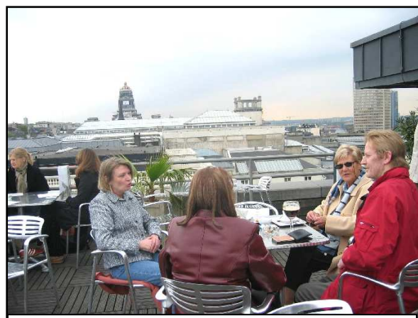
Op het dakterras van het Instrumentenmuseum