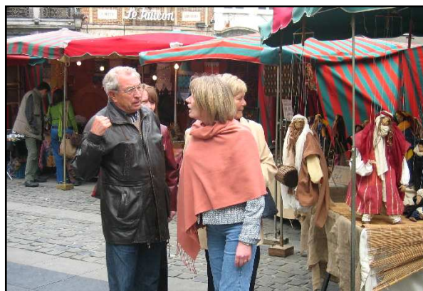
Enige "toelichting" vereist op een antiekmarktje ...

Waarna uitvoerig gedineerd werd in het restaurantje "La Villette" op de Vismarkt.