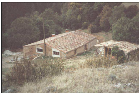
Arques: het Huis en het "Huisje"