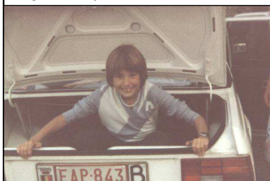
Als gewezen autofreak...

vrijwel exact dezelfde dingen bezig als ik (php, my Sql). Soit, 'k moet eens verder gaan werken. Moest je problemen hebben met de instellingen van je mail en internet e.d., geef me maar een belletje, zal wel zien dat 'k ergens een gaatje kan vrijmaken.