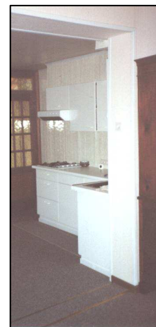
Links: een hoekje uit de salon - Rechts: de keuken